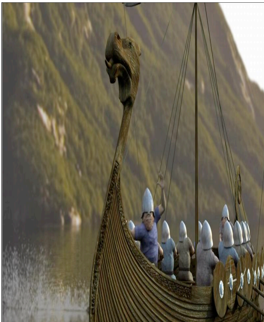
Visco, som jobber med visuell kommunikasjon, har fått i oppdrag å lage en skytevideo av Rogaland som skal vises under forumet. Her er et screenshot fra introduksjonsfilmen.

Cartoon Forum er ikke bare en møteplass for bransjen. I løpet av de fire dagene messen varer, vil du få anledning til å se det beste fra animasjonsverdenen på kino - helt gratis.