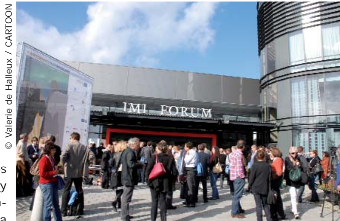
La ciudad noruega de Stavanger fue la anfitriona de esta edición

Siguiendo con los españoles con más visitantes, tenemos a Screen 21 (BRB) y Genoma Animation con Suckers ( The Secret Life of Suckers ), con 157 participantes en el pitching, de los cuales 66 eran inversores. Poco antes de que empezara el foro se conoció la noticia de que Disney ha adquirido los derechos de emisión de esta serie sin diálogos para niños de entre 8 y 12 años (aunque con un humor universal y alcanzable a adultos). Con un formato muy breve (104 episodios de dos minutos