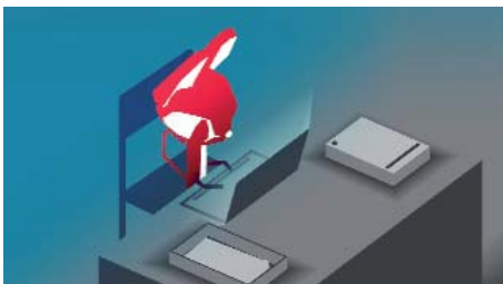
Please Say Something es el cortometraje de David O'Reilly que ganó el Cartoon d'Or

Somuga presentó su tercer proyecto en Cartoon Forum: Los Cuantos ( The Howoldies ) en el que los personajes tienen el cuerpo y el nombre de los números. La primera temporada está pensada en 78 episodios de un minutos con poco más de 500.000 euros de presupuesto y utilizando técnicas de Harmony y PhotoShop. Los escenarios son collages que además pueden servir para que los niños jueguen a averiguar qué materiales aparecen. Basora y EITB participan en la producción que aún necesita algo más de financiación.