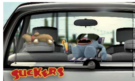
El principal canal de Disney en Estados Unidos emitirá Suckers de BRB

europea (Irlanda, Alemania, Reino Unido), Dodu, the Cardboard Boy , procedente de Portugal (Sardinha en Lata), y la gamberra Kinky & Cosy (Francia y Bélgica).