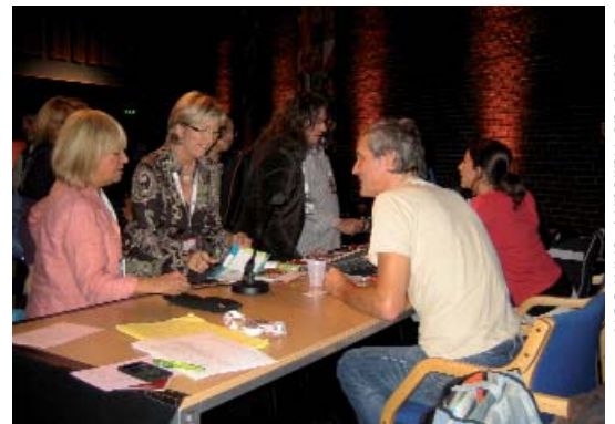
El equipo de Magoproduction tras el pitching de Las Ardillas Voladoras ( The Flying Squirrels )

Cambiando de registro, llegamos a Girls' Things , una serie de Tomavistas, empresa con ocho años de andadura. Esta vez van hacia un público de entre 9 y 12 años preferentemente femenino, dado que narra los cambios que vive una chica en plena pubertad. Con el apoyo de la BBC, pretende informar y entretener siempre desde el punto de vista de la comedia. TV3 y Planetnemo, entre otros, han mostrado interés en la coproducción. También con grandes posibilidades educativas Zebra Animation presentó Bru & Bla , una serie sobre la vida y la labor de las señales de tráfico. Aunque la primera intención es entretener, la productora es consciente de que el proyecto