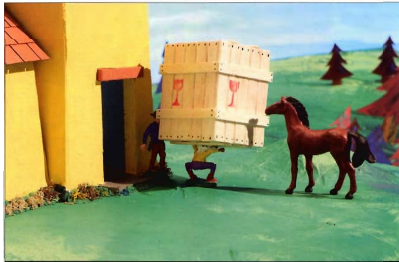
Après "Panique au village" la série, le long métrage s'appête à gagner les salles françaises: le film, réalisé par Stéphane Aubier et Vincent Patar, sort le 28 octobre.

C artoon Forum, Norvège, fin septembre. Ellipsanime et Belvision présentent Kinky & Cosy , une série humoristique dont les héroïnes sont deux jumelles complètement déjantées. Leurs aventures sont tirées de la bande dessinée éponyme et seront réalisées par Nix, l'auteur. Sur 61 projets présentés à Cartoon Forum, seuls deux s'adressaient à un public d'ados et d'adultes, dont celui-ci. La présentation du projet Kinky & Cosy a réalisé la performance d'être le