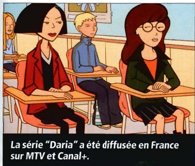
La série "Daria" a été diffusée en France sur MTV et Canal+.

désaffection du public ados, en particulier pour l'animation. "C'est la cible qui quitte le plus facilement la télé, pour aller notamment sur les réseaux sociaux", explique Julien Borde. France Télévisions a décidé de miser sur la fiction jeunesse pour séduire cette tranche d'âge. "A partir de 12-13 ans, les jeunes commencent à basculer vers les fictions télé, reconnaît Christophe Thorat. Mais le président