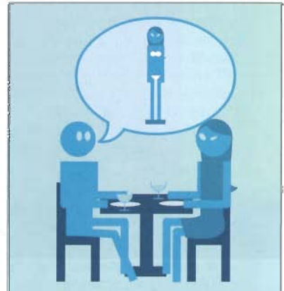
"Blinklife", projet porté à Cartoon Forum par les Britanniques de Le Singe Media.