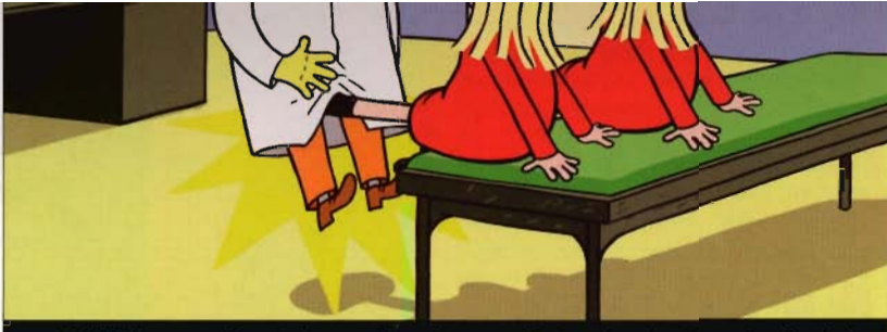
La série "Kinky & Cosy", produite Par Ellipsanime et Belvision, s'est classée en tête des pitches français les plus suivis à Cartoon Forum (quatrième sur l'ensemble).