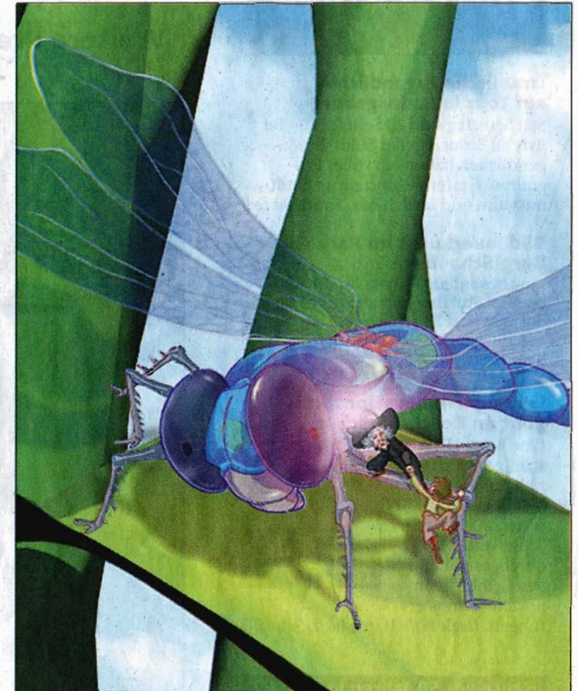
„Sagenhafte Abenteuer im Königreich der Insekten“: Das Studio 88 sucht für diese Serie Geldgeber.