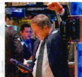
« QU'EST-CE QU'ON mange c... di ? », semble se demander ce... de la Bourse de New York.

Cette semaine, il n'y e... pour la crise des ma... nanciers : les « subprimes »... te de la banque d'affaires a... ne Lehman Brothers, les... quotidiennes des actions... se... De quoi couper l'a... plus d'un épargnant.