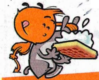
NELSON trouve en 2D une dimension propice au rire.

Les Bruxellois de Nexus Factory, associés aux Gantois de Tinkertree, ont fait souffler un vent de terreur écologique sur la côte belge avec Plankton Invasion . En 7 minutes, Joeri Christiaen met la côte belge en état d'alerte climatique. Une étoile de mer qui se la pète à la Rambo veut réchauffer la planète vite fait et submerger le pays. C'est parodique, apocalyptique, politiquement incorrect. Le trailer est déjà culte sur le net avec plus de 10.000 fans ( www.planktoninva-