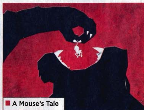
■ A Mouse's Tale