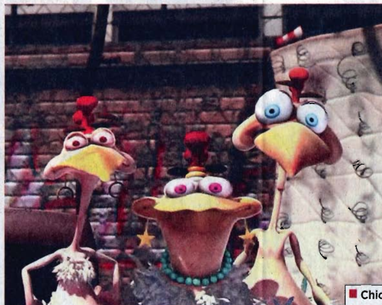
■ Chicken Town