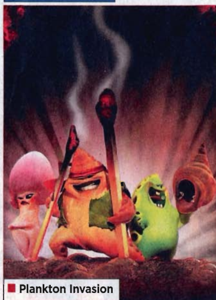
■ Plankton Invasion

Cartoon Forum laat programma-aankopers kennismaken met nieuwste creaties