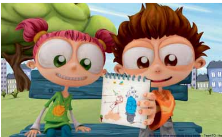
Comment faire enrager tout le monde de Chloé Miller, production Team to, distribution Cake Entertainment.

Au traité tout aussi élaboré, une 3D « aquarelle », Petit à petit (produc-