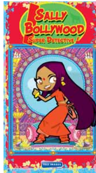
Sally Bollywood produite par Télé Images Kids.

Autre propriété propre qui mutualise les ressources, Sally Bollywood de Télé Images Kids. S'inspirant de Scoubidou ou Inspecteur Gadget , la série utilise adroitement les ressorts de l'enquête et la comédie à la Bollywood. De même que pour Football de rue , lorsqu'elle sera à l'antenne (début 2009 sur France 3), le public sera déjà familiarisé avec le sujet: « Nous allons développer simultanément plusieurs applications « multimédia », détaille Philippe Alessandri. Un site Internet proposera aux enfants de devenir membres de l'agence de détective; Un album de pop indienne réunira toutes les chan-