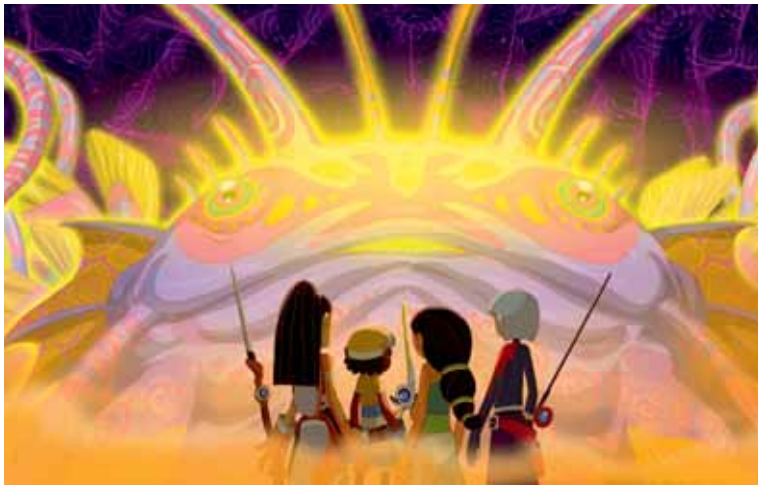
Astaquana par Olivier Jongerlyncq, produite par Sip Animation.

caricatures de duo fictif. Ouat Entertainment développera la marque d'abord pour le Web puis à la télévision à raison de 52 fois 13 minutes. La série au style manga, animée sous Flash, After Effects et 3D S Max, diffusera alors les meilleurs matches: les candidats ayant été préalablement sélectionnés lors de concours organisés sur des consoles Wii, XBLA, ou le mobile.