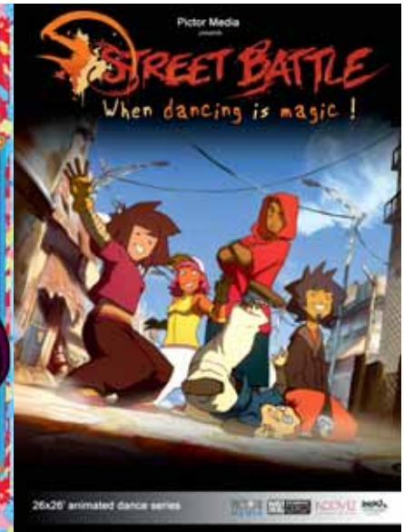
Street Battle de Pictor Media.

sons créées pour la série, lesquelles seront également exploitées en « mobile »; enfin il y aura une édition de livres et de bande dessinée. » Cette série de 52 fois 13 minutes (au budget de 7 millions d'euros) sera animée sur After Effects par Je suis bien content. La chaîne de fabrication mise en place est prévue pour permettre un partage d'animation avec un autre studio.