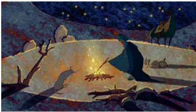
LE CHAMEAU ET SA BOSSE

Des histoires comme ça de Jean-Jacques Prunès, production les Films de l'Arlequin.