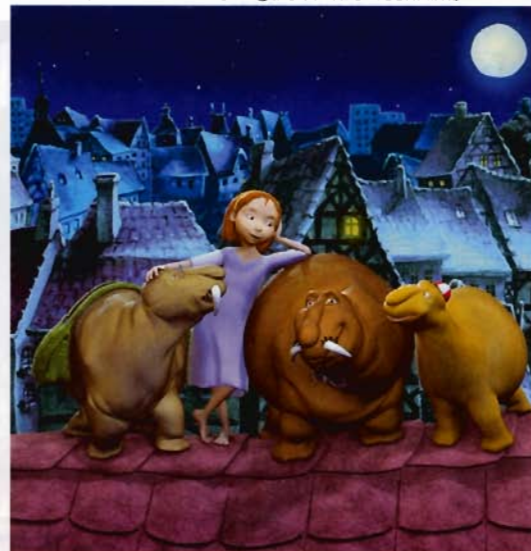
Die Moffels

» The Bunjies « von Studio Film Bilder aus Stuttgart belegten vom internationalen Interesse her mit 213 Besuchern, darunter 100 Investoren, Platz fünf. Die 26x26-minütige 3D-Serie ist simpel gehalten. Das