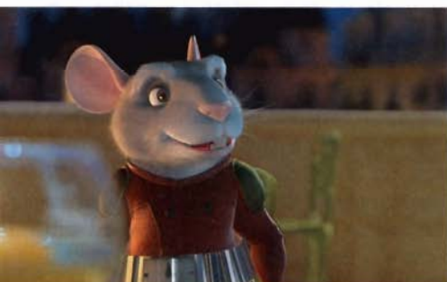
The Hairy Tooth Fairy

Erfrischend anders in der Thematik richtet sich die geplante 2D/3D-Animationsserie » Globul-X « von 52x7 Minuten an sechs bis neun Jahre alte Kinder. Die Geschichten drehen sich um drei Superhelden, die im Körper des Hauptdarstellers Elliot, eines neun Jahre alten Jungen, leben. Ziel der einzelnen Folgen ist, Kindern zu erklären, was rote und weiße Blutkörperchen sowie rote Blutplättchen im Körper eines Menschen in ständiger Aktion hält. Da gibt es Viren und Bakterien,