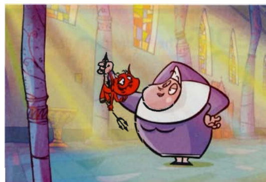
Fred!