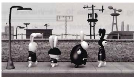
The Bunjies

Design der vier musizierenden und witzig, cool quatschenden Hasen ist klar und streng gehalten, komplexe Animation ist nicht vorgesehen. Die Songs der Musiktruppe sollen für Mobiltelefone vertrieben wer-