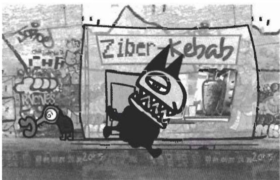
● Friends & Chips , de Rec-estudio