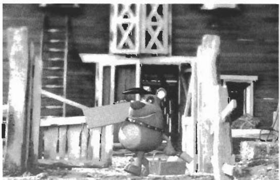
● Farmtastic , de Dibulitooon