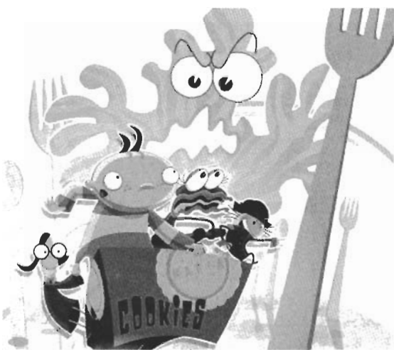
● Sicco & Sicco , de Pausoka

Año tras año las iniciativas Cartoon han recibido el apoyo del Programa MEDIA (MEDIA 1, MEDIA 2, MEDIA Plus, MEDIA Formación), erigiéndose en una de las iniciativas más veteranas y consolidadas, que mejor representan al sector de la animación europea. ♦