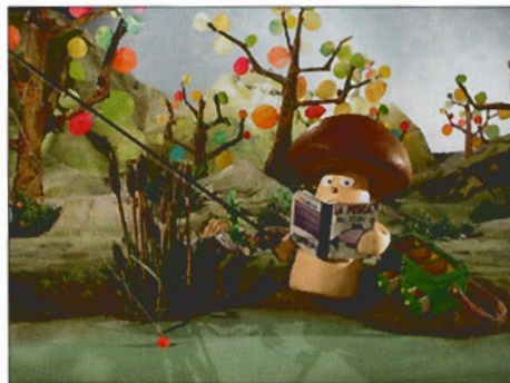
Capelito © Estudio Rodolfo Pastor

Einen hohen Anspruch an die Vermittlung von Wissen über unseren Planeten haben die beiden spanischen Firmen RenderArea aus Madrid und Explora Films aus Alcobendas mit ihrer Serie » Noah 21 st Century «. RenderArea hat in den vergangenen Jahre über 80 Animationsprojekte realisiert. Explora Films ist im Bereich Dokumentarfilm tätig und hat auf fünf Kontinenten in den vergangenen 20 Jahren enorm viele Filmaufnahmen gedreht. Mit einer Mischung aus 3D und Realfilm sollen 26 Folgen à 22