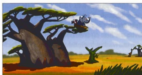
Minifant - Forgotten Tales from Okavango © Toons 'N' Tales

Um witzige Lebensmittel-Darsteller geht es in der Serie » Fridgees « von der fish blowing bubbles GmbH aus München. Die Charaktere werden in 3D mit ToonShader generiert und agieren vor 2D-Hintergründen in einer Mischung aus Komödie und Aben-