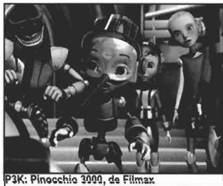
P3K: Pinocchio 3000, de Filmmax

Maze of Dreams: Ventura in Hypnos Island , por su parte, fue una de las grandes sorpresas de Cartoon Forum 2004. Producida por la productora gallega Grándola Nova, la serie des-