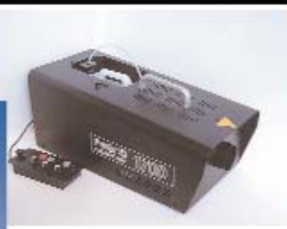
Máquina de Humo Rosco Modelo 1700