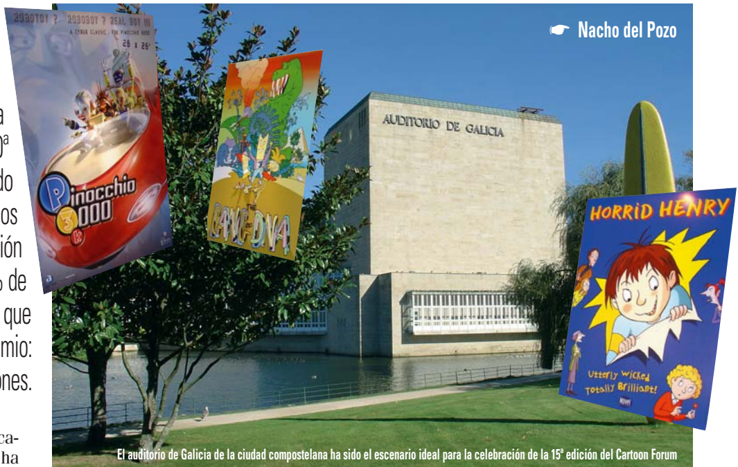
El auditorio de Galicia de la ciudad compostelana ha sido el escenario ideal para la celebración de la 15ª edición del Cartoon Forum

Santiago de Compostela se ha convertido en la número 15, edición que sin duda ha confirmado a España como uno de los principales animadores del concierto europeo. Y es que, a bote pronto, casi todo han sido buenos datos para la animación espa-