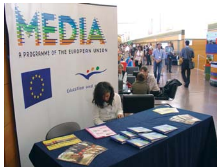
El programa MEDIA de la Unión Europea apoya a la industria de la animación con eventos como el Cartoon Forum. A la dcha., presentaciones de las producciones españolas Sandra (Icon Animation) y Papawa (BRB)