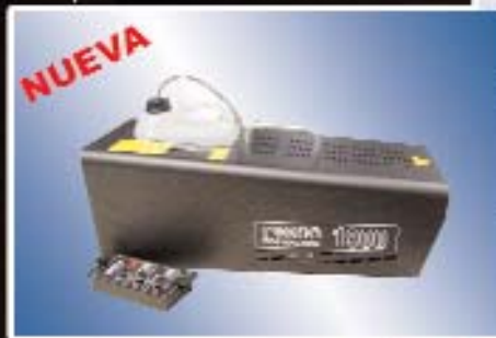
Máquina de Humo Rosco Modelo 1900

¡Sencillamente, póngase en contacto con nosotros para una demostración GRATIS!