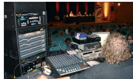
El equipamiento técnico de este 15º Cartoon Forum, transportado desde centro Europa, al igual que el personal técnico, incluía varios proyectores SXGA 6000 y un XGA 10000 de Panasonic, así como numerosas pantallas de plasma LG, y un más que correcto equipamiento de sonido

13x15' de muñecos de televisión). Entre el otro 37% restante, los de más de 10.000€, han habido 3 proyectos de más de 15.000€ y otros tantos de más de 20.000. En total, se han presentado 69 proyectos que han representado 246 millones de Euros para alrededor de 460 horas de programación con un coste medio de 8.900€ por minuto.