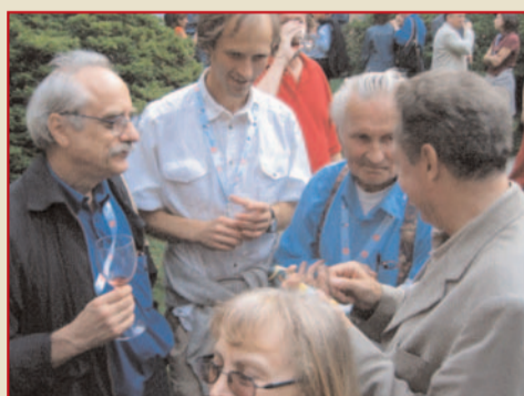
TAPAS PER FUZELLIER E ALTRI AUTORI AL FORUM.