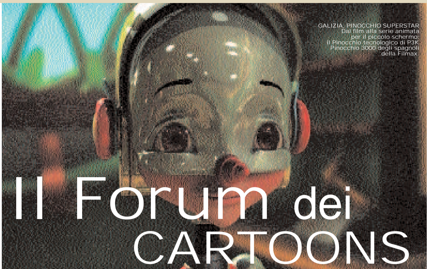
GALIZIA, PINOCCHIO SUPERSTAR Dal film alla serie animata per il piccolo schermo: il Pinocchio tecnologico di P3K Pinocchio 3000 degli spagnoli della Filmmax.

Il Forum assegna anche il tradizionale Cartoon d'Or : statuetta all'austriaco Virgil Widrich, un giovane che ha ramazzato già ben 29 premi nei festival internazionali in cui ha iscritto il suo Fast film , un cortometraggio che ora gli porta anche i 15mila Euro che gli consentiranno di iniziare un nuovo lavoro, sia esso un cortometraggio, un film o uno speciale Tv. Come dire, Cartoon spinge gli autori al gran salto dall'opera d'autore alla serialità e al lavoro commerciale, ma premiando l'autorialità. D'altra parte un gran numero dei progetti del Forum galiziano si muovono indifferentemente su una piattaforma crossmediale, concepiti in un multiformato: dalla serie Tv al sito web, dal Cd al dvd, fino ai giochi e all'interattività. Per non contare l'attenzione al merchandising e al licensing, che oggi sono la grande leva che muove i fenomeni di successo. E per chiudere i bilanci, va ricordato che nelle ultime 14 edizioni del Forum un terzo dei progetti presentati è diventato realtà, per un totale di un miliardo di Euro. F.F.