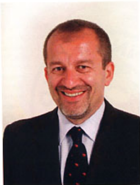
Nella foto: il ministro del Welfare Roberto Maroni

Cartoon Forum: un mix tra lavoro e possibilità di socializzare e visitare i dintorni per tutti i partecipanti.