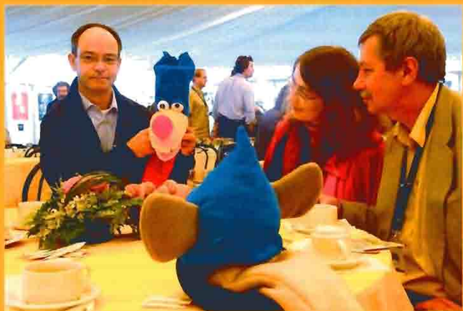
Oheistuotteiden tekeminen on entistä merkittävämpi osa tv-animaationkin tuottamista. Varesen Cartoon Forumissa niitä esiteltiin lounastauollakin.

Tuotantojen rahoitus koetaan tietysti myös entistä tarkemmin muista lähteistä kuin tv-esityksistä. Dvd-levy, kirjat, telut ja muut oheistuotteet kuuluvat kohta asiaan lähes joka animaatiotuotannolla, mallia otetaan Yhdysvalloista.